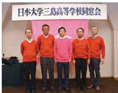
本年度還暦の第16期生