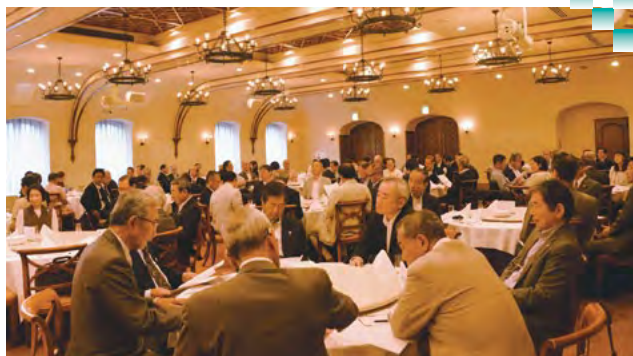
同窓会総会・懇親会風景

総会後の懇親会では、今年度中に還暦を迎えられた会員(16期生)への記念品贈呈などがあり、終始和やかに進みました。また、毎年恒例となっている空くじなしのくじ引き大会では、御殿場支部の企画・運営により、御殿場市の特産品が多数登場するなど大いに盛り上がりました。