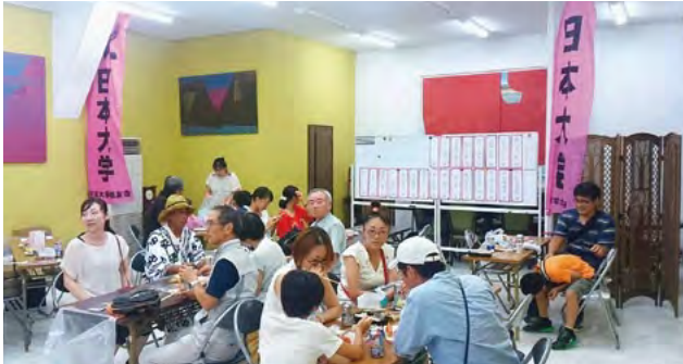
三島支部同窓生交流会