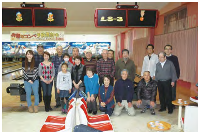
H29年2月17日親睦ボウリング大会にて