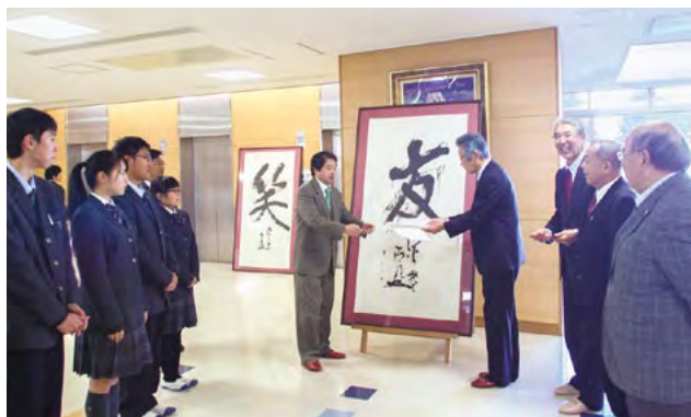
一字揮毫「友」額 贈呈式

皆さんが日大三島高校での楽しい思い出を胸に、これからの人生も笑顔で学び続けていかれることを心から祈念申し上げます。