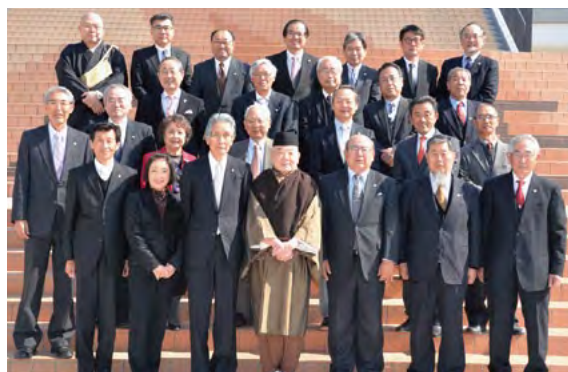
森清範貫主と記念撮影