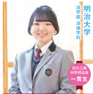
法学部 法律学科 明治大学

A 「自分に合ったやり方を見つける力」が身についたと感じています。夏まで部活動を続けながらの受験準備だったため、短い時間で結果を出す必要があり、自分に合う勉強方法や時間の使い方を試行錯誤しました。定期テスト前には部活の仲間と練習後に学校に残って勉強したり、バス移動などの隙間時間を活用したりと、状況に応じて学習スタイルを調整しました。この経験から、物事には人それぞれ合った方法があり、それを見つけることが成果につながる最適な道だと学びました。