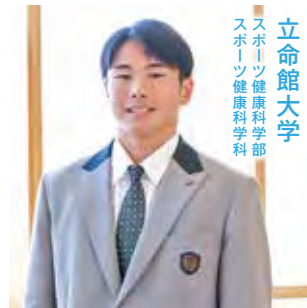
スポーツ健康科学部 スポーツ健康科学科 立命館大学

A 模試の成績が伸び悩み、勉強の進め方や進路について迷っていた時に、先生に相談しました。基礎を固めるための学習内容や計画の立て方、使用する問題集について親身にアドバイスをいただき、前向きな気持ちで勉強に取り組めるようになりました。放課後や休日に教室を開放してくださったことも、集中して学習する上で大きな支えでした。これから受験を迎える後輩には、日々の積み重ねを大切にしてほしいです。小さな目標を立て、それを継続することで、すぐに結果が出なくても確実に力になります。自分を信じて、最後まで頑張ってください。応援しています！