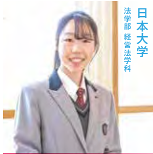
法学部 経営法学科 日本大学