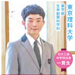
薬学部 生命創薬科学科 東京理科大学

A 進路の選択肢を広げたい思いから、学業や課外活動の両方に力を入れすぎて気持ちが疲れてしまう時期がありました。そこで勉強は分単位で計画を立て、一日の終わりに全て取り組むことができた自分を認めることで、自信を積み重ねていきました。受験期には、家族がいてくれるお茶が心を落ち着かせてくれる存在でした。ラクノス同好会では、テスト前や引退のタイミングを区切りに勉強へ集中し、メリハリを意識して取り組みました。これから受験を迎える後輩には、小さな楽しみを見つけたり、時に自分を認めたり、素直な気持ちを言葉にしたりして、自信やモチベーションにつなげていってほしいです。笑顔で4月を迎えられることを心から願っています！