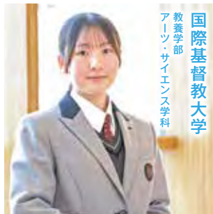
教養学部 アーツ・サイエンス学科 国際基督教大学

A 受験生活で最も大変だったのは、苦手分野に継続して取り組むことでした。苦手な科目は楽しさを感じにくく、勉強自体が嫌になることもありますが、少しずつ克服できている自分を実感することで、やりがいを見出せるようになりました。アカデミックコースは生徒数が比較的少なく、他クラスの生徒とも関わりやすい環境です。面接練習を共にする仲間を見つけやすく、先生方も一人ひとりに合わせた丁寧な指導をしてくださりました。これから受験を迎える後輩の皆さんには、一人で抱え込まず先生や友人に素直に頼ることを大切にしてほしいと思います。皆さんの健闘を願っています！