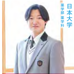
薬学部 薬学科 日本大学

A 日大三島での経験の中でも、1年間の留学は大きな成長につながりました。留学先では、自分から行動しなければ英語力も経験も伸びないため、毎日が挑戦の連続でした。思うようにいかず落ち込むこともありましたが、その分、やり遂げた時の達成感は大きく、自信につながりました。この経験を通して、興味を持ったことには臆せず挑戦する姿勢が身についたと感じています。